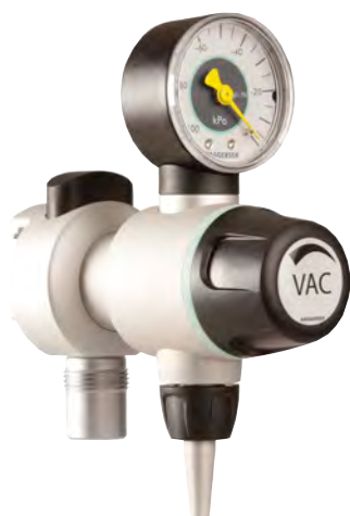
Pirol Schienengerät .....