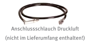
Anschluss Schlauch Druckluft (nicht im Lieferumfang enthalten!)

Die fahrbare Einheit ermöglicht eine Frühmobilisation des Patienten und gleichzeitig eine sehr sichere Aufbewahrung sämtlichen für die Absaugung notwendigen Zubehörs. Hohe Variabilität der eingesetzten Sekretauffangsysteme, sowohl was den Hersteller als auch die Größe der Behälter betrifft.