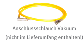
Anschluss Schlauch Vakuum (nicht im Lieferumfang enthalten!)