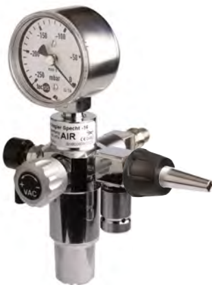
.....Specht -16 Steckgerät

i *andere länderspezifische Anschlüsse auf Anfrage (z. B. British Standard BS 5682, Skandinavischer Standard SS 87 524 30, etc.)