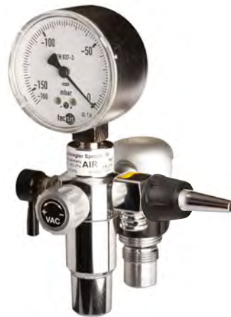
Specht -10 Schienengerät.....

(*Niederdruck-Schlauchleitung siehe Seite 044)