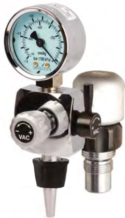
Spatz -90 Schienengerät.....