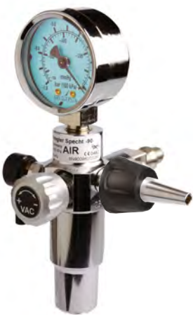
.....Specht -90 Steckgerät