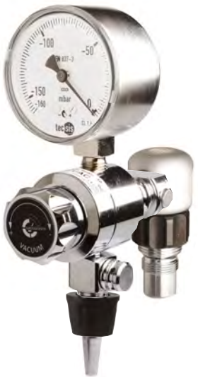
Spatz -10 Schienengerät.....