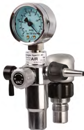
Specht -90 Schienengerät .....

Die bewährte Produktfamilie SPECHT überzeugt durch Langlebigkeit und Zuverlässigkeit. Der eingesetzte Ejektor erzeugt mithilfe von Druckluft ein stabiles Vakuum. Das frontal angebrachte Feinregulierungsventil ermöglicht dem Anwender eine feine Einstellung des gewünschten Vakuums. Das zusätzliche Schnellschlussventil dient zum schnellen An- und Ausschalten, ohne das jeweils eingestellte Vakuum zu verändern.