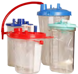
Beispiele für kompatible Behälter