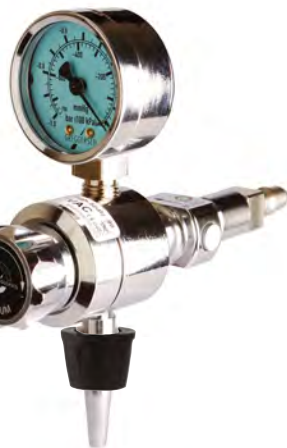
..... High Spatz -90 Steckgerät