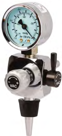
..... Spatz -90 Steckgerät